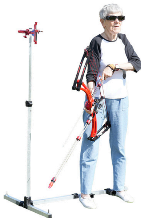
Une polence pour aider le para-archer à se placer et viser