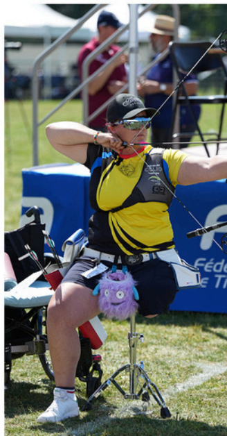
Si manque d'équilibre : assise