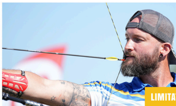
Tir en mordant un morceau de cuir