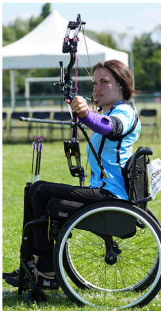
Pas d'adaptation particulière