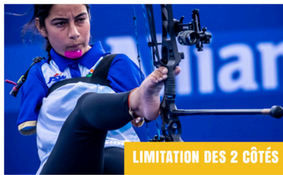
Mise en tension de l'arc avec le pied