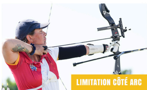
Tenue de l'arc avec une sangle