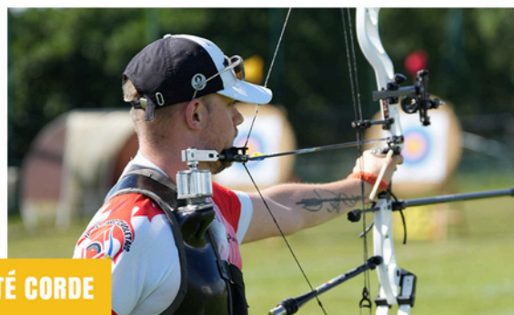
Tir à l'aide d'un outil mécanique appelé "décocheur"